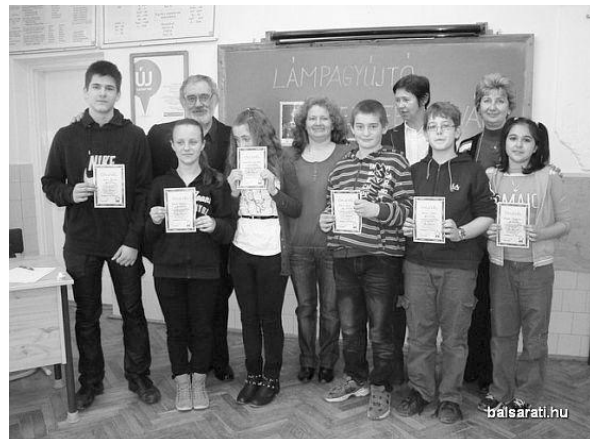
A magyaros hónap versenyek helyezettjei